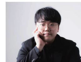
작·편곡 | 박지수